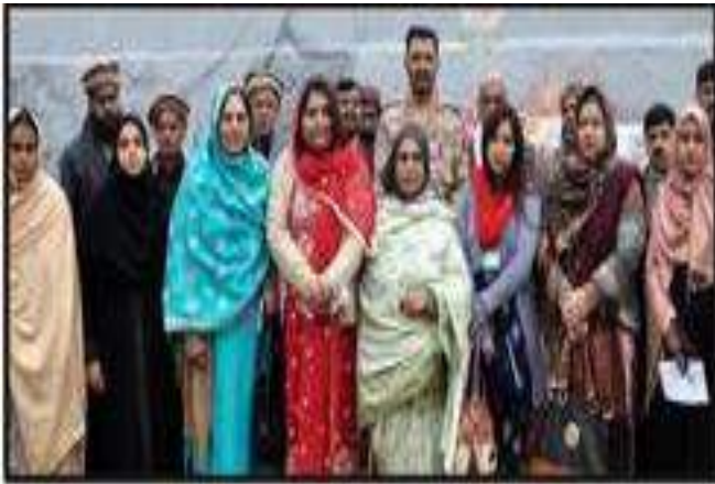
ماہ پندرہ ماہی کارنگس فورس کے ذرا آج کی خوشگوار اور خوشحال شہر سے شائع ہونے والی اخبار