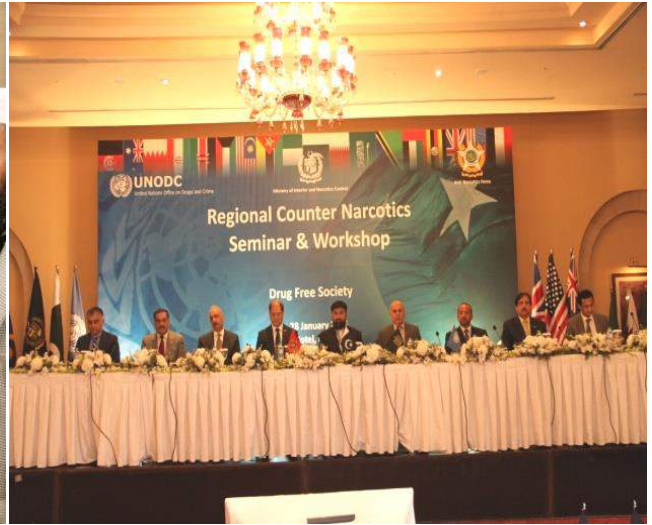
Speakers of the Seminar