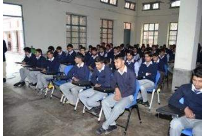
Awareness Lecture at Govt. M.C Higher Secondary School Faisalabad – 26 th Jan15