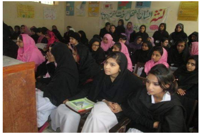
Awareness Lecture at Govt. Inter Girls College Ravi Road Lahore – 22 nd Jan15