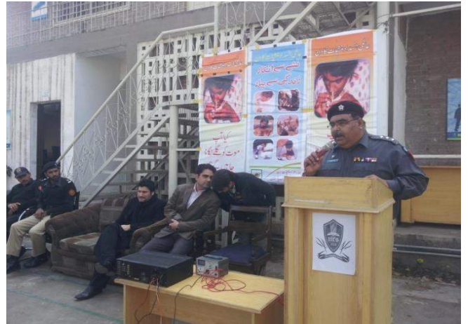
Awareness Lecture at NCS University Peshawar – 26 th Jan 15