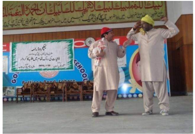
Delivered Lecture/ Play at Govt. Center Model School Rattical Road Lahore - 22 nd Jan15