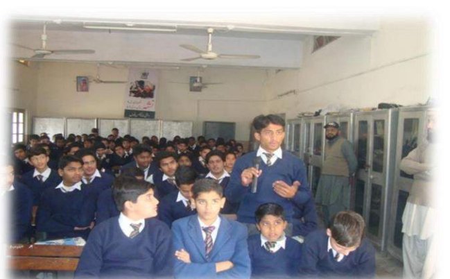
Awareness Lecture held at Isb Model School for Boys Model Town Humak - 29 th Jan 15