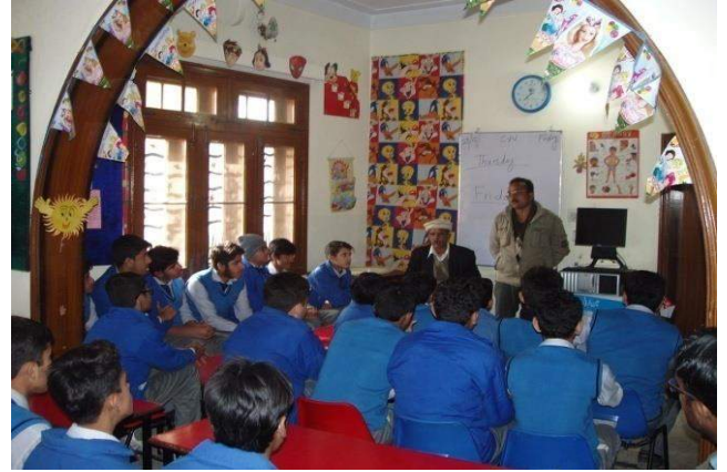
Awareness Lecture at Allied Public School - 23 rd Jan 15