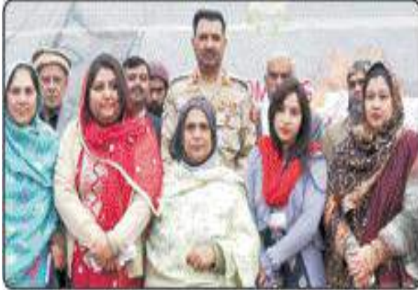
اسلام آباد کے ذرا آج کی خوشگوار اور خوشحال شہر سے شائع ہونے والی اخبار