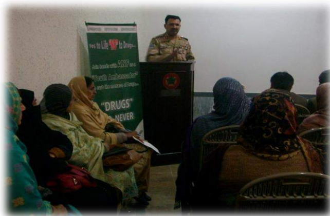
Awareness Session held at RD-North - 21 st Jan 15