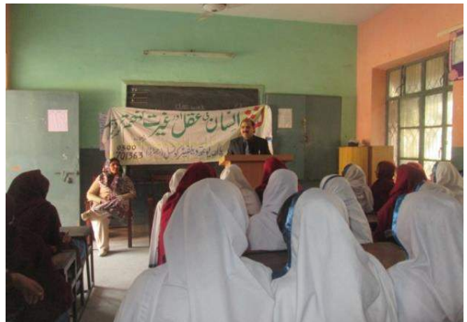
Awareness Lecture at Govt. Chirag Girls High School Beghum Pura Lahore – 24 th Jan15