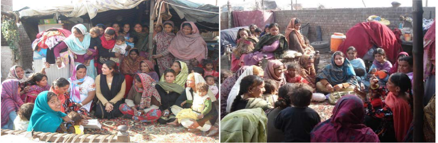
Awareness Lecture at Bagrian Pind Lahore – 2 nd Jan 15