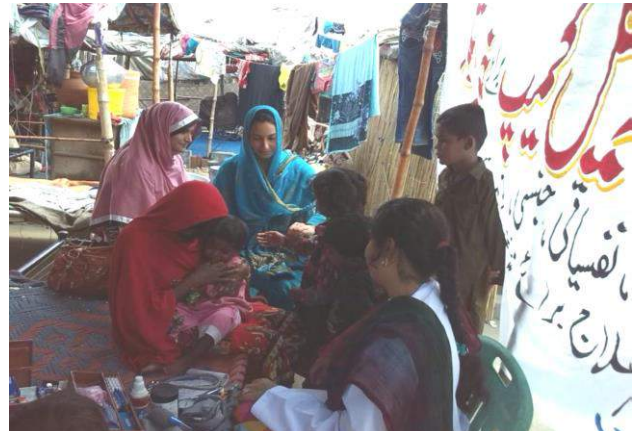
Medical Camp at Tallian Wala, Wasti Chowk Lahore – 4 th to 9 th Jan 15