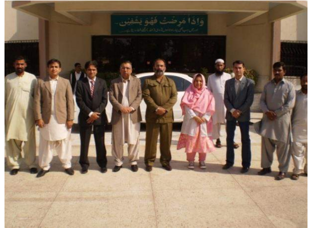
Joint Secretary with MATReC staff Karachi