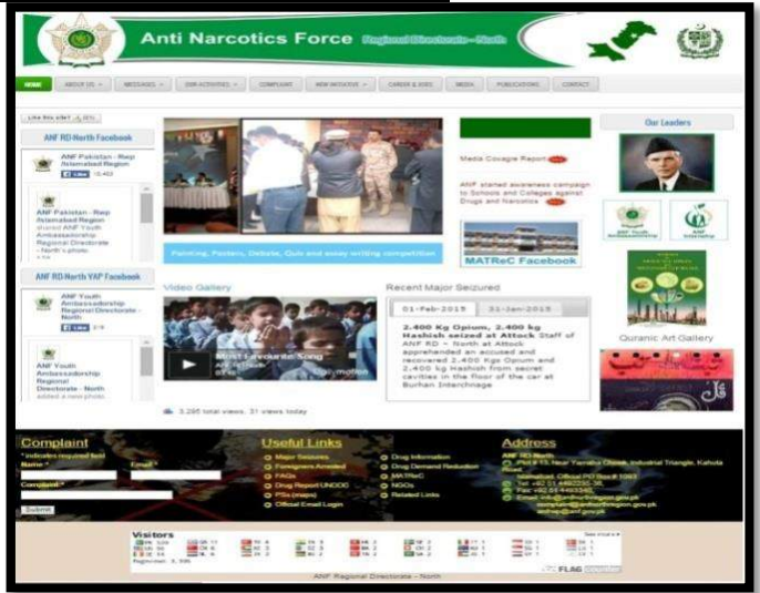
Launched RD North Website – 7 th Jan 15