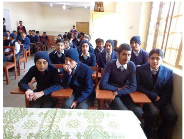
Awareness Lecture at Model Public School Haripur – 27 th Jan 15