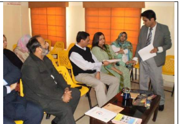
Meeting between Karwan-e-Hayat ANF MATReC staff